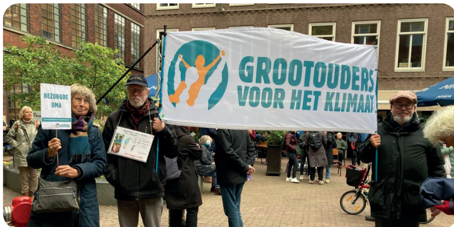
Foto: de Brakke Grond was één van de verzamelplaatsen

Hieraan werd deelgenomen door een delegatie van de Grootouders, naast veel andere organisaties en individuele burgers.