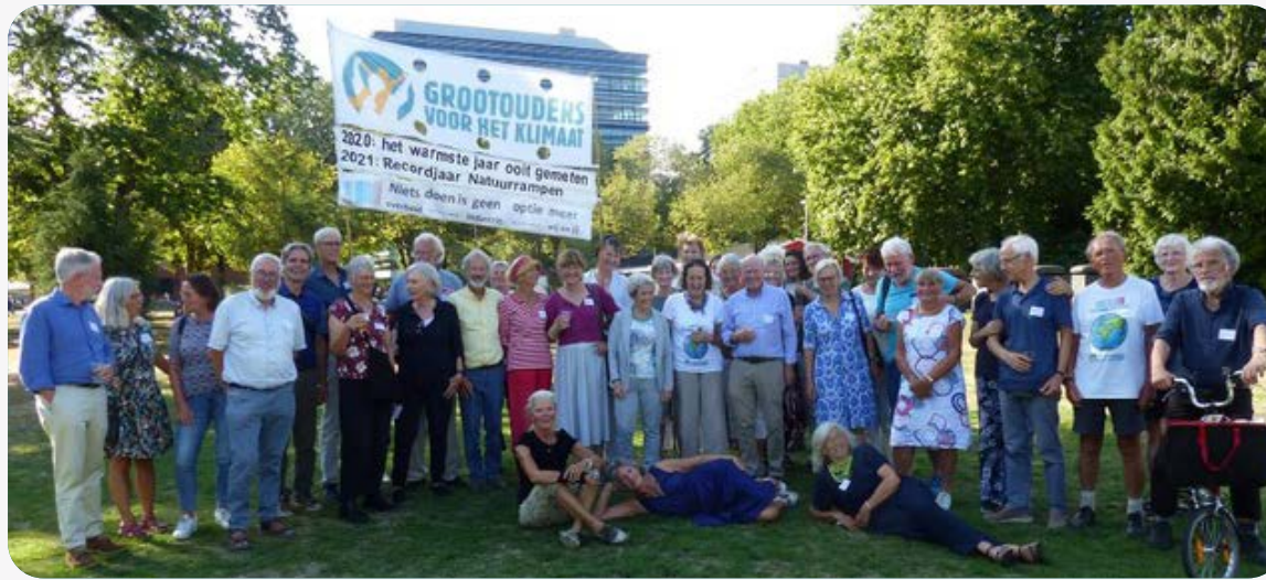
Een aantal vrijwilligers aan het eind van de inspiratiedag