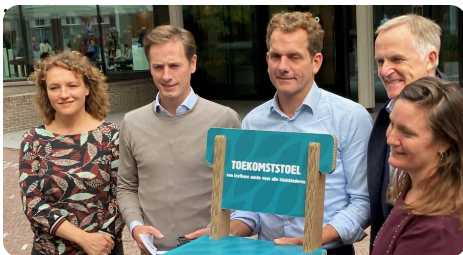
Vijf Tweede-Kamerleden met de Toekomststoel.

De Pleindemo van 27 september was de start van de Campagne Toekomststoel .