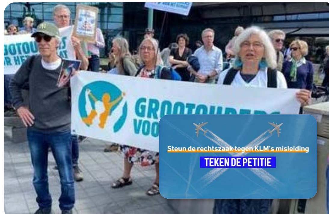
Foto bij Schiphol. Ook bij andere luchthavens waren individuele Grootouders aanwezig.

In de erop volgende maand was er bovendien een actie tegen misleidende reclame door KLM. Via internet kon een petitie worden getekend en we hebben opgeroepen daaraan mee te doen.