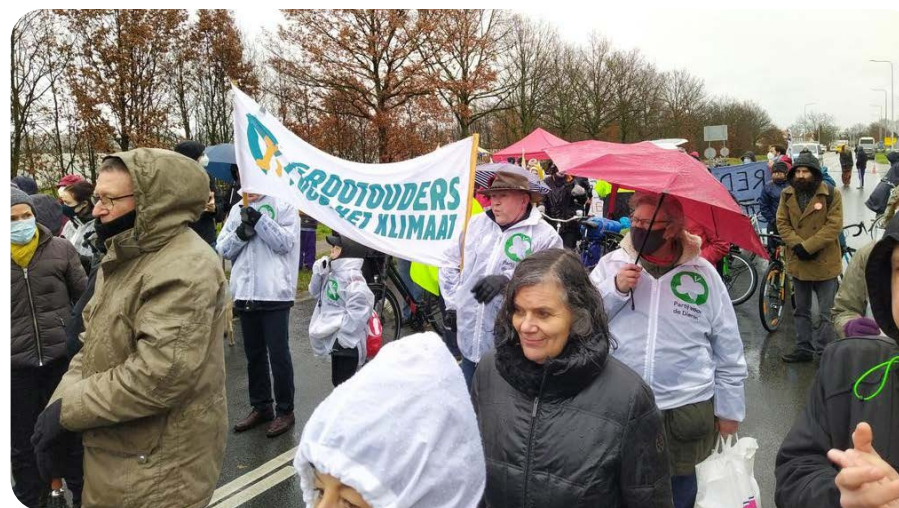
Demonstratie bij het Sterrebos