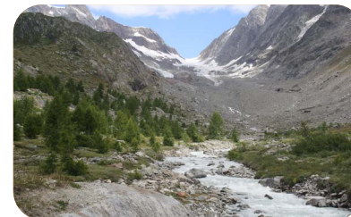
De Langgletsjer in Zwitserland, in de verte te zien, kwam in 1933 tot de plek waar de fotograaf staat

Ook al zijn er veel mooie kabinetsplannen om klimaatverandering tegen te gaan, de uitvoering ervan is veel te traag om de Nederlandse klimaatdoelen te halen. Dat werd duidelijk uit de Klimaat- en Energieverkenning, de KEV, een jaarlijks rapport van het Planbureau voor de Leefomgeving, in samenwerking met onder meer het CBS, RIVM en TNO. De KEV vloeit voort uit de Klimaatwet en geeft de stand van zaken over de uitstoot tot en met 2030. Er zijn meer en grotere ambities en plannen dan ooit, van zowel de Europese Commissie als het kabinet, maar het schort aan de uitwerking en uitvoering van die ambities en plannen, concludeert het rapport. Het kabinet wil dat er in 2030 in Nederland 60 procent minder broeikasgassen worden uitgestoten ten opzichte van 1990. Dat is zelfs iets scherper dan de 55% die in de EU is afgesproken. In de raming van de KEV blijft Nederland in 2030 steken op 39 tot 50 procent, als wordt gekeken naar concreet en uitgewerkt beleid.