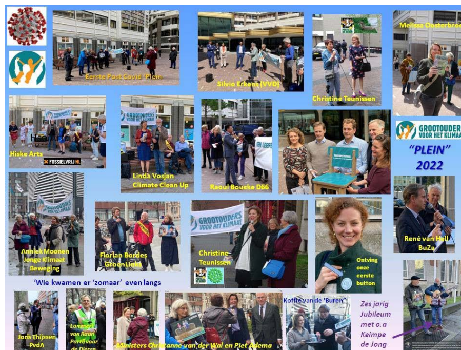
Collage met Pleingasten 2022

De Pleindemonstraties werden door een aantal Grootouders gecombineerd met deelname aan de Klimaatwake. De Klimaatwakers hebben begin dit jaar hun permanente wake die tijdens de kabinetsformatie plaatsvond, omgezet in een wekelijkse processie. Elke donderdag tussen 12.00 en 14.00 uur werden zeven symbolische rondjes om het Ministerie van Economische Zaken en Klimaat afgelegd, met als voornaamste boodschap de overheidssteun voor de fossiele economie te stoppen.